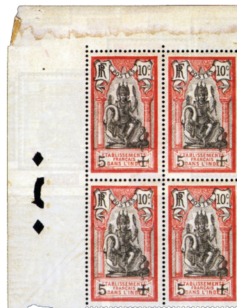
Surcharge noire (Achats collections - 74 ème vente sur offres - 15 sept 2011)