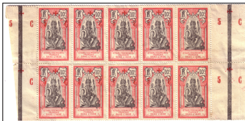
Yvert 46 en bloc de 10, surcharge III. La composition typographique fait apparaître la surcharge sur les interpanneaux. Par contre la surcharge a été omise sur la première rangée de l'interpanneau.

A noter que je n'ai jamais vu le timbre à date de Chandernagor sur ces timbres.