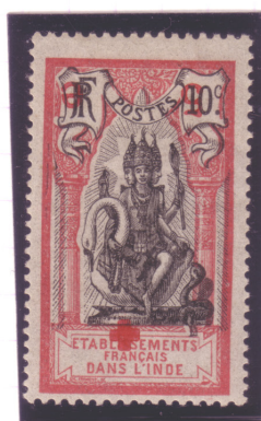
47 D (E)