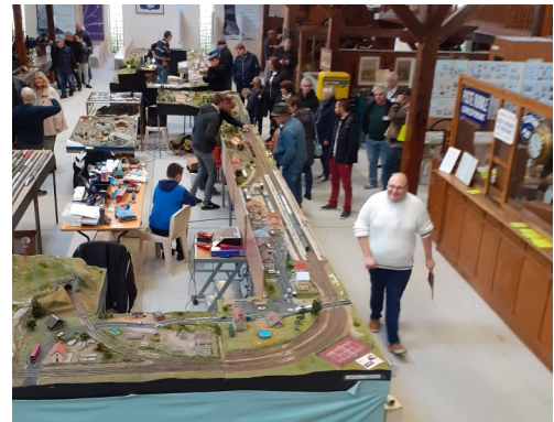
L'Amicale ferroviaire auboise