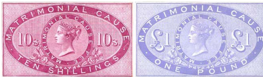
essai du poinçon 10 shillings et 1 livre

Une série de timbres fiscaux intitulés MATRIMONIAL CAUSE a été imprimée pour payer la taxe due par les appelants au tribunal des affaires matrimoniales.