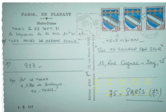
Carte postale pour Paris. Oblitération de Thiais du 22 septembre 71.