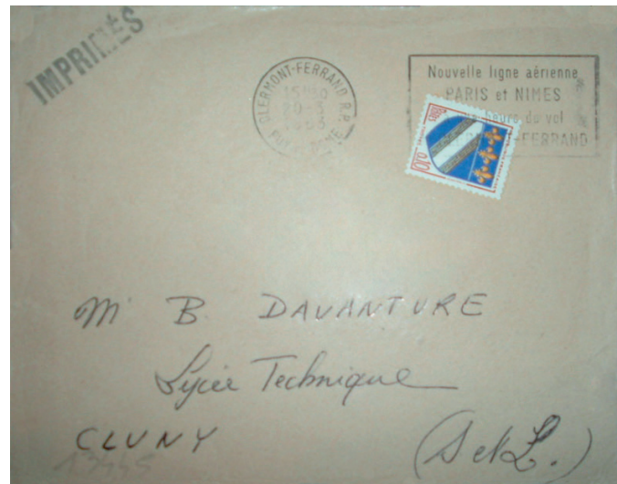
Enveloppe pour imprimés. Oblitération de Clermont-Ferrand du 20 mars 63.

Mais le 10 c. a principalement servi comme valeur d'appoint pendant sa longue carrière.