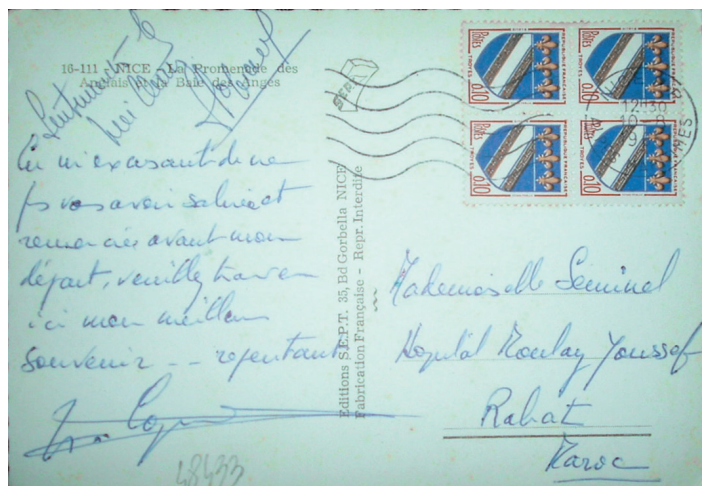
Carte postale pour l'étranger. Oblitération de Nice du 10 août 64.