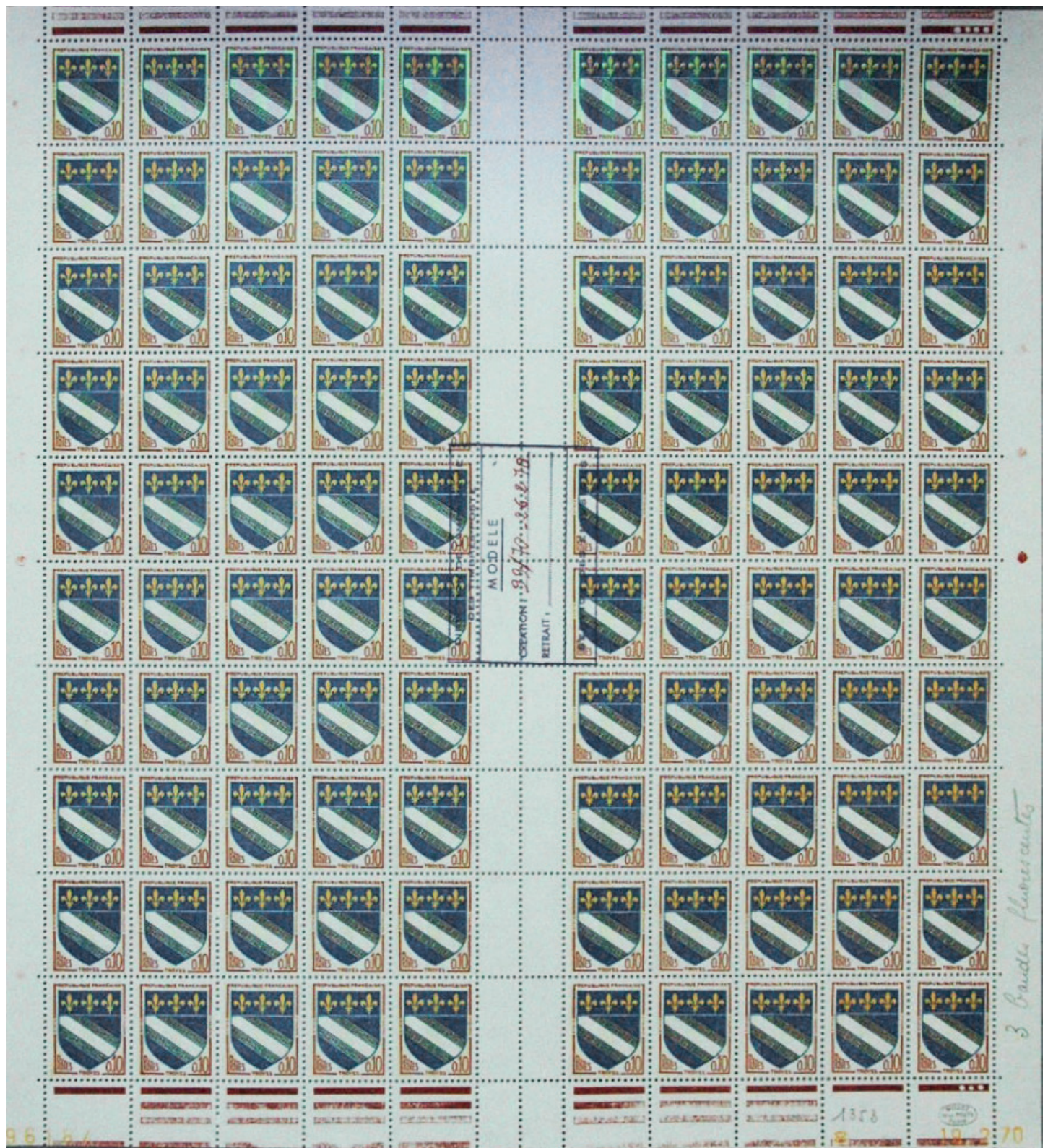
Feuille modèle Blason de Troyes avec trois barres de phosphorescence du 19 février 1971