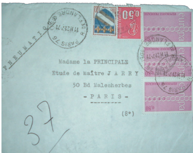
Enveloppe par pneumatique de 1971, affranchie à 3 F.

Mais le 10 c. a principalement servi comme valeur d'appoint pendant sa longue carrière.