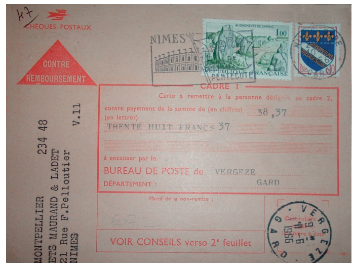
Mandat carte contre remboursement de 1966, affranchi à 1 F. 10.