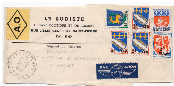
Bande journal par avion pour la France, affranchissement à 33 f. CFA. Oblitération de St Pierre de la Réunion du 30 mai 69.

Il a été principalement utilisé pour les imprimés et en complément d'affranchissement.