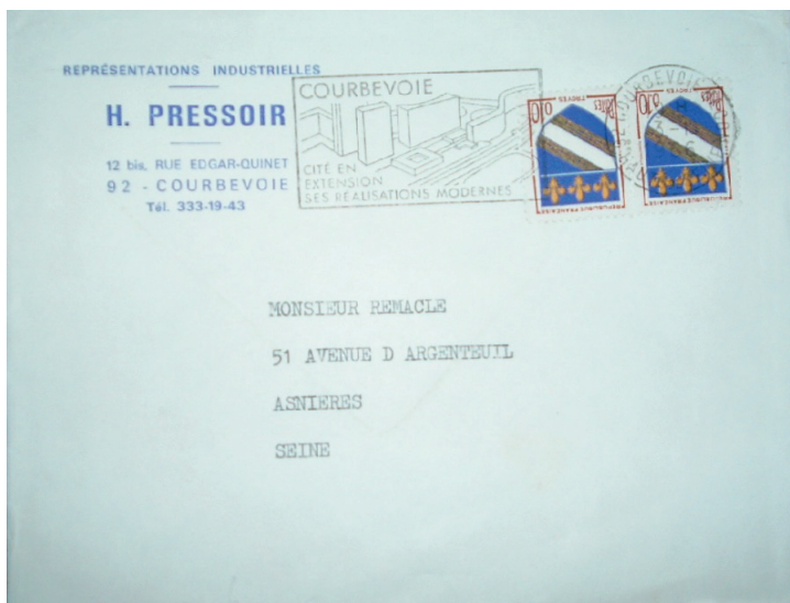
Enveloppe pour imprimés ordinaires jusqu'à 50 g. Oblitération de Courbevoie du 3 décembre 66.

Le 10 c. a souvent été utilisé en multiple pour affranchir des cartes postales ou des lettres.