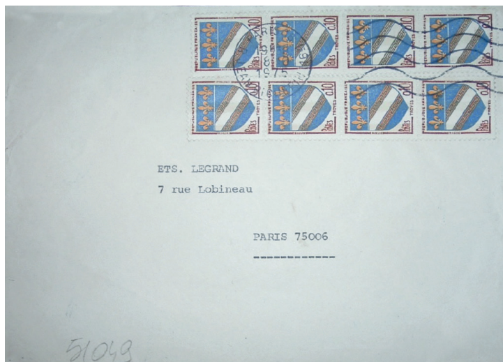
Enveloppe pour Paris. Oblitération de Paris du 8 octobre 75.